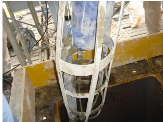
特殊バイブレータ装置