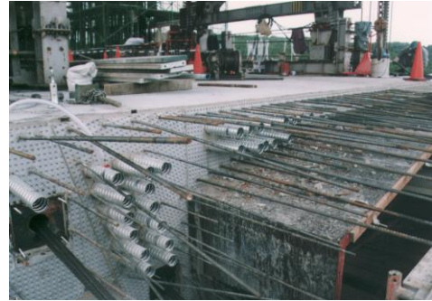
写真-1 打継目の施工状況