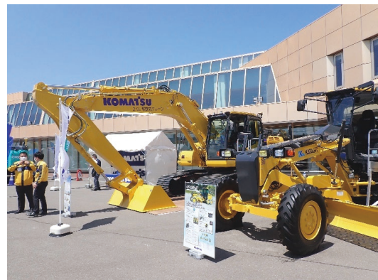
令和4年度 開催状況