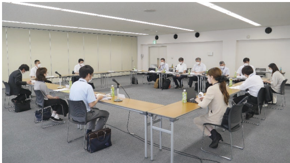
令和4年度 開催状況

電子入札コアシステムをご利用いただいている北海道内の団体の皆様にご参加いただき、6月22日に開催予定で準備を進めています。会議では、電子入札コアシステムの機能や運用の改善に向けて、電子入札コアシステム開発コンソーシアム事務局から「コアシステムに関する動向」、「コアシステム関連技術」等についてご説明と情報提供をさせて頂き、ご利用の皆様の間で、ご意見、ご要望を共有させていただくために開催いたします。令和2年、令和3年は新型コロナウイルス感染拡大のため、資料回付により行いましたが、令和4年度からご利用の団体にお集まりいただいて実施しています。