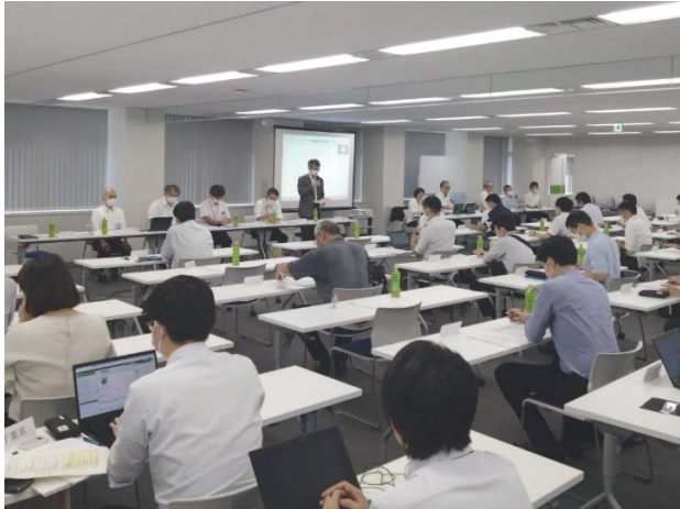
コアシステムユーザー会議の様子

また、参加した都県市等から電子入札のマルチデバイス化や紙入札併用の課題等の会員相互の意見交換が活発に行われました。