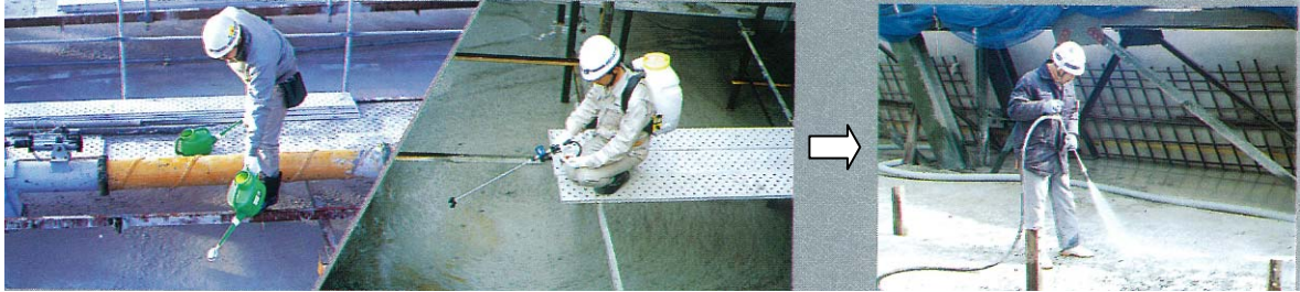
▲ジョウロによる散布 または ▲噴霧器による散布