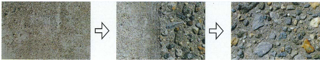
▲コンクリート打設

上記の特性を利用してコンクリート表面薄層部の水和反応を計画的に遅延させることが可能となり、打継ぎ強度を損なうことなく、打継ぎ処理の作業時間を従来より大幅に延長することが出来る。