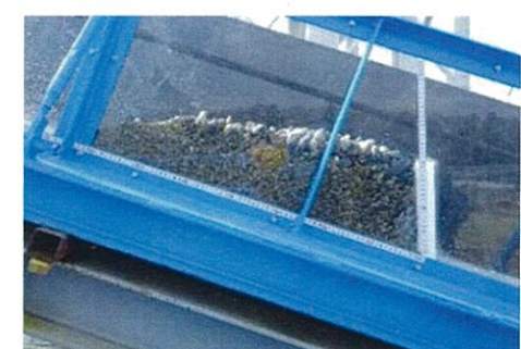
図-5 捕捉状況（水理模型実験側面）