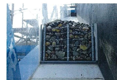
図-4 捕捉状況（水理模型実験正面）