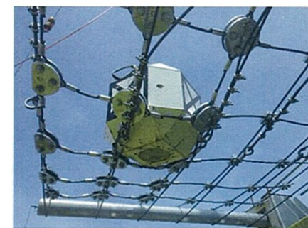
図-3 捕捉状況（実物大実験）